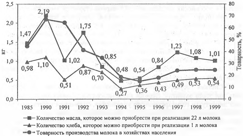
Соотношение цен на молоко, закупаемое у населения, и цен на хлеб и животное масло на потребительском рынке

Резкое падение закупок при возрастающем производстве во многом связано с замещением молоком других продовольственных товаров в условиях опережающего роста цен на последние и недостаточного стимулирования реализации продукции. На рисунке представлены кривые соотношения цен на молоко, закупаемое в хозяйствах населения, и цен на хлеб и масло животное на потребительском рынке. Сопоставление их с товарностью молока свидетельствует о высокой взаимообусловленности связи.