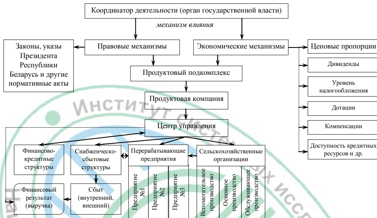
Рис. 1. Организационно-экономический механизм функционирования продуктовой компании (холдингового типа) с участием сельскохозяйственных организаций

на создание кластерных образований и транснациональных корпораций (ТНК) [5].