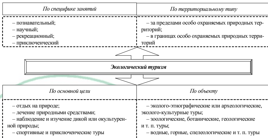
Рис. 2. Виды экологического туризма

Примечание. Рисунок составлен на основании проведенных исследований и [6].